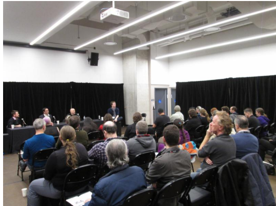
A wonderful CQICTS Meet & Greet on January 18, 2017 at Usine C in Montréal // Superbe rencontre CQICTS le 18 janvier 2017 à l'Usine C Montréal