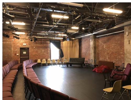
Saint John Theatre Company Hub and BMO Studio Theatre // Le Hub et le Studio BMO du Saint John Theatre Company