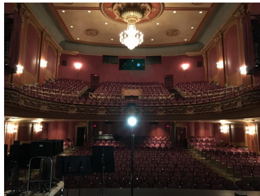
Imperial Theatre exterior and stage // La façade et la scène du Imperial Theatre