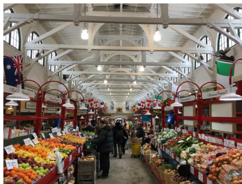
View of Saint John from the Delta Hotel and the Saint John Public Market // Vu de Saint-Jean du Delta Hotel et le marché public de Saint-Jean

We are looking forward to greeting you this August 9-12 2017 in Saint John NB for Rendez-vous 2017 .